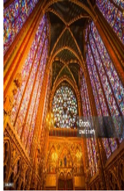
La Sainte Chapelle

- la Sainte Chapelle , dite aussi Sainte-Chapelle du Palais, est une chapelle palatine édifée sur l'île de la Cité, à Paris, à la demande de Saint Louis afin d'abriter la Sainte Couronne d'épines, un morceau de la Vraie Croix, et d'autres reliques de la Passion.