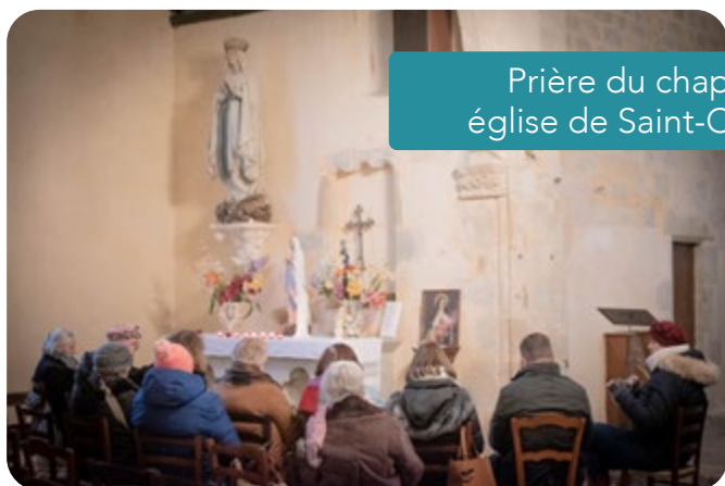
Prière du chapelet, église de Saint-Clément

La prière est comme la sève qui 'irrigue' toutes les branches d'un arbre, leur donnant vitalité et croissance. Dans l'Église, elle se fait tantôt louange et action de grâce, tantôt intercession et