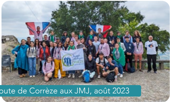
Route de Corrèze aux JMJ, août 2023

de leur âge, les aura confortés dans leur foi et, espérons-le, leur aura donné un élan missionnaire. À l'arrivée du car à Brive, un père qui venait attendre sa fille m'a dit ceci : « Voir un 1, 5 million de jeunes autour du Pape à Lisbonne, ça veut dire que la jeunesse est une grande source d'Espérance pour l'Église et pour le monde ! »