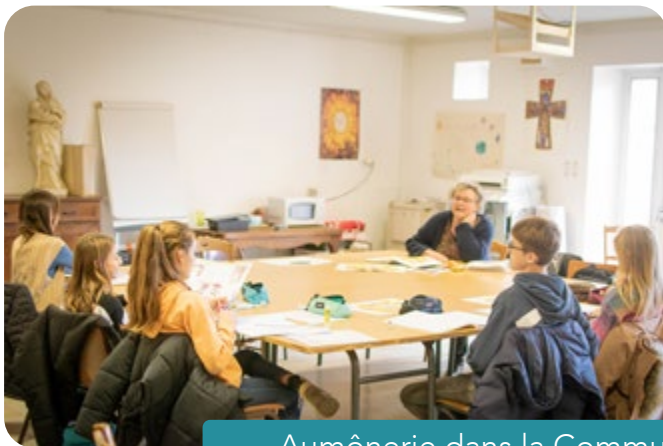
Aumônerie dans la Communauté locale d'Objat

► Le nombre de jeunes dans les aumôneries paroissiales a diminué, surtout dans les Communautés rurales. Mais les prêtres et les animateurs en pastorale des jeunes, dans les quatre Espaces missionnaires, en paroisse et dans les Établissements scolaires catholiques, continuent, avec beaucoup de zèle missionnaire, d'accompagner les jeunes et de les préparer du mieux possible à la profession de foi et à la confirmation. Je les en remercie. J'en profite aussi pour remercier les catéchistes, bénévoles, qui dans toutes les Communautés Locales et les Écoles consacrent du temps et beaucoup d'énergie, avec un grand esprit de foi, au service de la formation chrétienne des enfants.