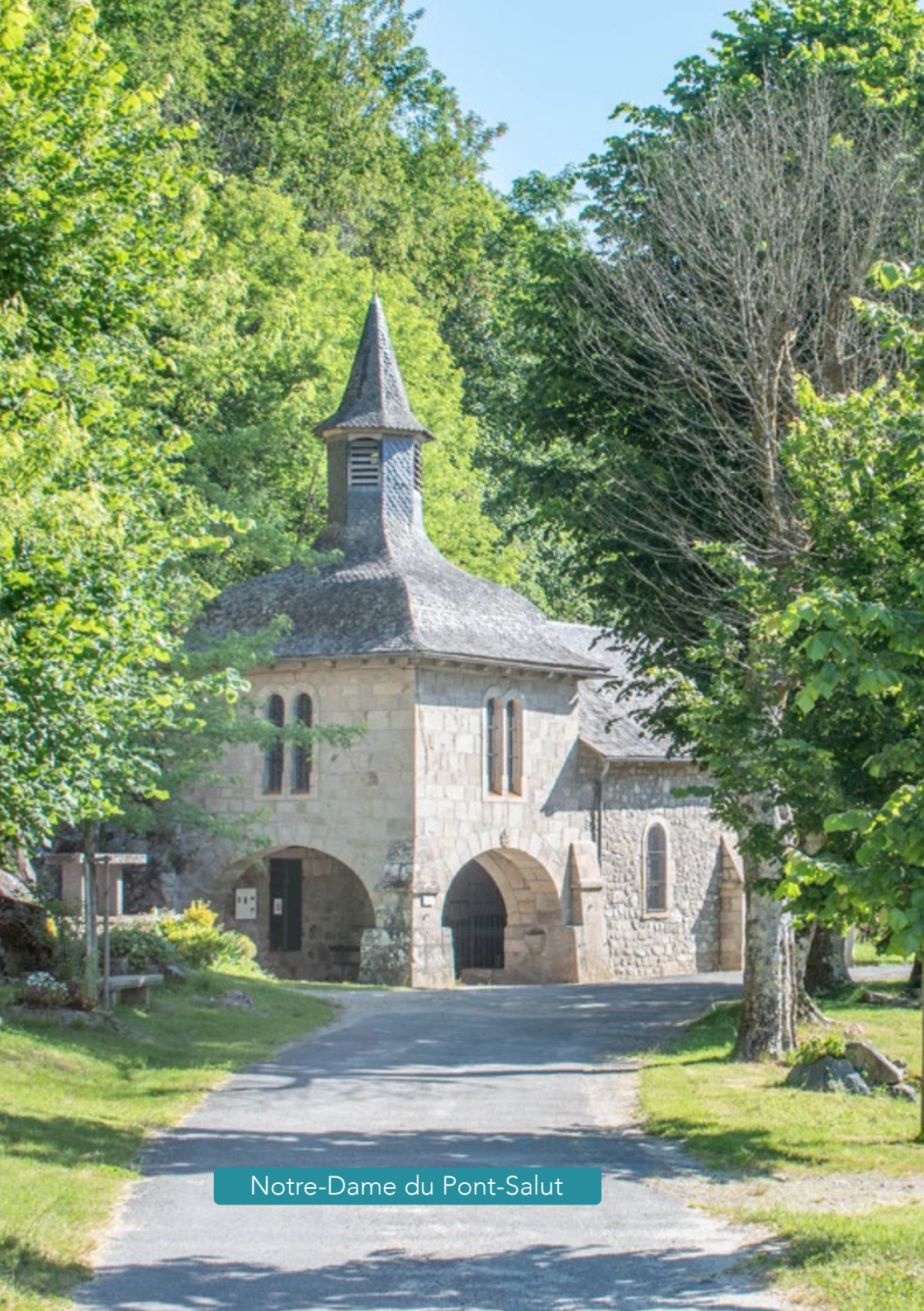
Notre-Dame du Pont-Salut