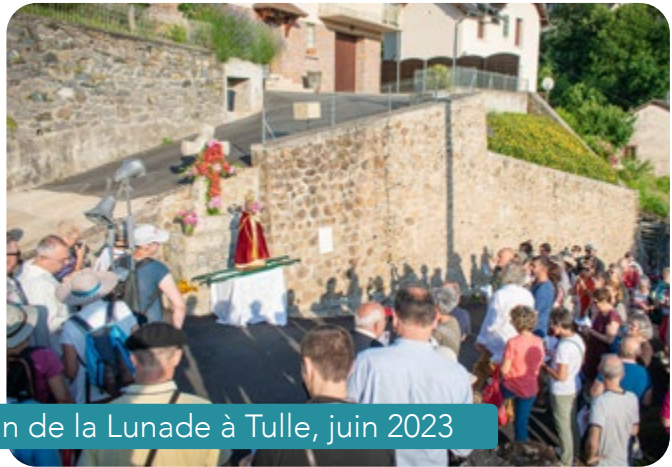
Procession de la Lunade à Tulle, juin 2023

Tout ce qui blesse la communion ecclésiale est un obstacle à la mission. Tertullien, un des premiers écrivains chrétiens, rapporte ce que l'on disait des chrétiens : « Voyez comme ils s'aiment ! » Jésus l'avait recommandé à ses disciples : « Je vous donne un commandement nouveau : c'est de vous aimer les uns les autres. Comme je vous ai aimés, vous aussi aimez-vous les uns les autres. À ceci, tous reconnaîtront que vous êtes mes disciples : si vous avez de l'amour les uns pour les autres. » (Jn 13, 34-35) C'est donc par l'amour entre les chrétiens que nous témoignons du Christ et que nous sommes missionnaires. Nous faisons des disciples en vivant nous-mêmes du Christ et de son amour. Ceci est la base de toute vie chrétienne et de tout apostolat. Nous pouvons aussi relire l'hymne à la charité dans la première lettre de saint Paul aux Corinthiens (13, 1-13).