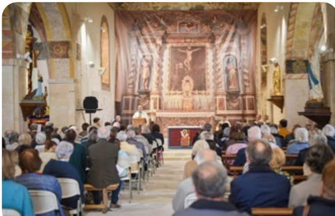
Réouverture de l'église de Voutezac, mai 2023

Est-ce à dire qu'il n'y ait pas de vie sur ces territoires ? Malgré les graves problèmes démographiques, il existe une volonté chez les habitants et les élus municipaux et départementaux de tout faire pour maintenir et pour créer des activités. On constate dans plusieurs communes l'arrivée de nouveaux habitants. Mais la vie ecclésiale, faute de renouvellement, du vieillissement des fidèles, de l'éloignement des prêtres, s'amenuise, au point de disparaître. D'où la désespérance pour les quelques chrétiens qui restent. Dans ce contexte, c'est bien difficile de constituer une Équipe d'Animation pastorale, et, quand elle existe, d'en renouveler les membres.