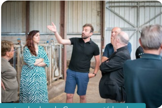
Visite pastorale dans la Communauté locale d'Arnac-Pompadour et Lubersac, juin 2023

Pour mes visites pastorales (deux par an, mais interrompues pendant presque deux ans à cause du Covid), j'ai donné la priorité aux petites Communautés locales éloignées des grands centres. Pendant une semaine, du matin au soir, accompagné du prêtre et des membres de l'E.A.P ou d'autres personnes actives, je parcours le territoire, faisant toujours de belles rencontres, en écoutant ce qui se vit, en essayant d'encourager et d'inviter quelques personnes, parmi celles encore en activité, à prendre des initiatives. Mais, je vois bien que c'est difficile.