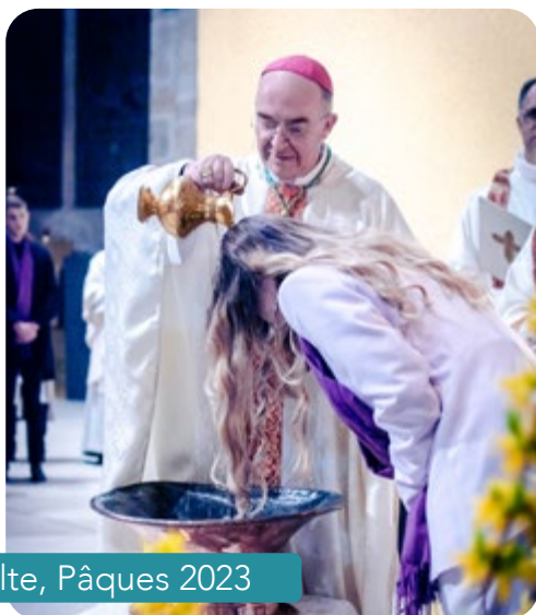
Baptême d'adulte, Pâques 2023

veloppement du catéchuménat de l'enfance, de l'adolescence et de l'âge adulte est un grand motif d'action de grâces. Il nous donne à voir l'œuvre cachée de l'Esprit-Saint dans les cœurs. Merci à tous les accompagnateurs des catéchumènes, laïcs, prêtres, diacres et consacrés.