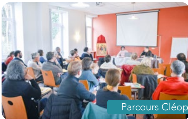
Parcours Cléophas 2022/2024