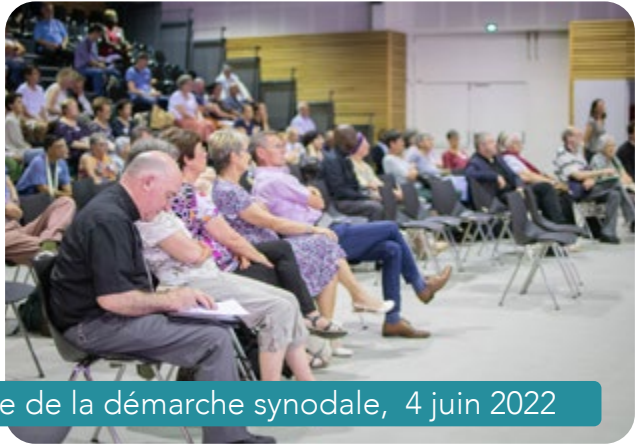
Clôture de la démarche synodale, 4 juin 2022

J'ai tardé à écrire cette Lettre pastorale , mais je souhaitais que le nouveau Conseil pastoral diocésain et le Conseil presbytéral puisse réagir aux remontées de la démarche synodale.