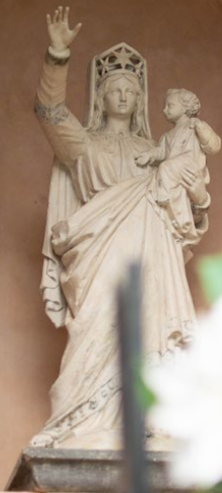
Notre-Dame de Pennacorn