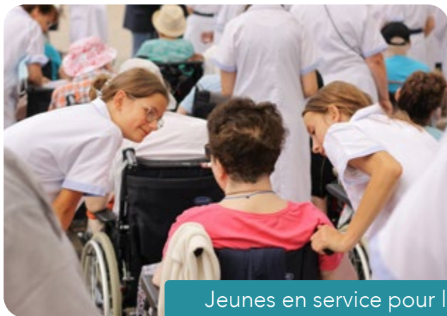
Jeunes en service pour l'Hospitalité diocésaine à Lourdes, août 2023

Solidaire, Équipes de Saint-Vincent-de-Paul, Ordre de Malte) sont bien vivantes, même si elles ont parfois du mal à renouveler leurs membres.