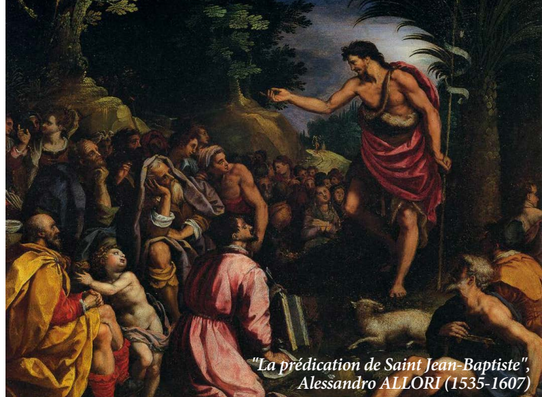
"La prédication de Saint Jean-Baptiste", Alessandro ALLORI (1535-1607)

Nous devons prendre acte que, malgré tout ce qui est dit sur lui, Jésus Christ est, dans notre culture, un paria . Il est complètement absent – et pour des motifs plus que compréhensibles – dans les trois principaux dialogues où la foi est engagée dans le monde contemporain : celui avec la science, celui avec la philosophie et celui entre les religions. Le but ultime n'est pas d'ordre théorique mais pratique. Il s'agit de remettre le Christ avant tout « au centre » de notre vie personnelle et de notre vision du monde, au centre des trois vertus théologiques : la foi, l'espérance et la charité. Noël est le moment le plus propice pour une telle réflexion, parce que cette fête nous rappelle le moment où le Verbe s'est fait chair, entrant, aussi physiquement, dans la création et dans l'histoire, dans l'espace et dans le temps. La prière eucharistique IV l'exprime ainsi :