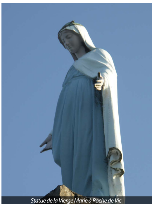
Statue de la Vierge Marie à Roche de Vic