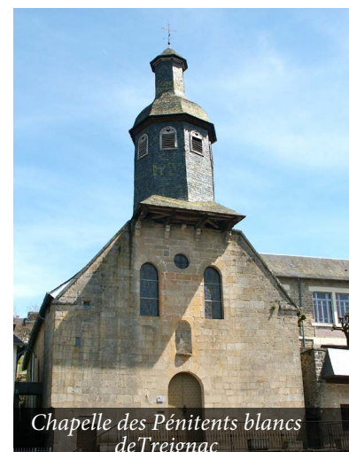
Chapelle des Pénitents blancs de Treignac