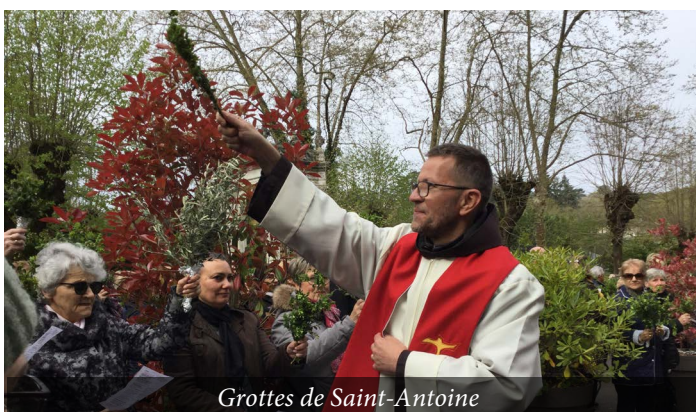
Grottes de Saint-Antoine