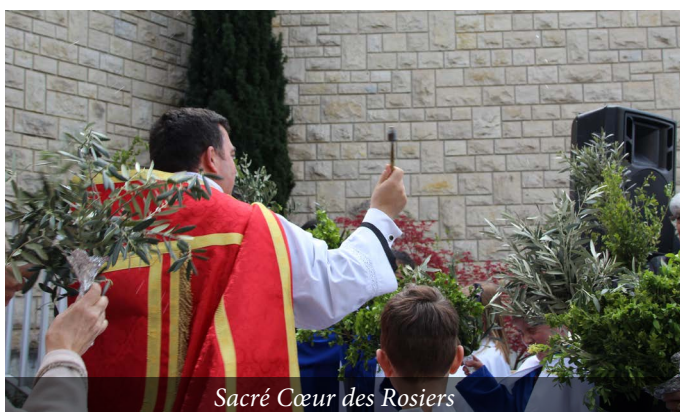
Sacré Cœur des Rosiers