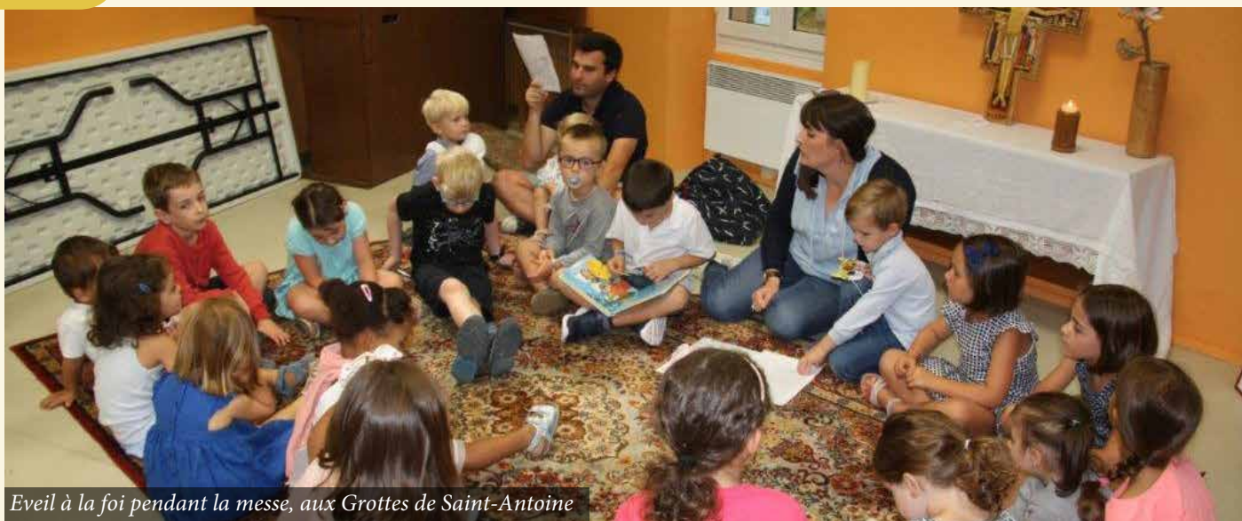
Éveil à la foi pendant la messe, aux Grottes de Saint-Antoine