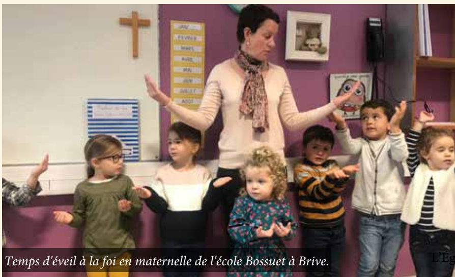
Temps d'éveil à la foi en maternelle de l'école Bossuet à Brive.

"Il est dommage de réduire Noël à une fête commerciale. La magie de Noël ce n'est pas le Père Noël, et si on ne leur dit rien ils croient au Père Noël ! N'est-ce pas infiniment plus beau de croire en Jésus Sauveur ?"