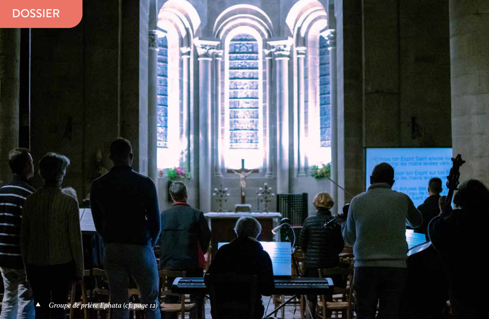
▲ Groupe de prière Ephata (cf. page 12)