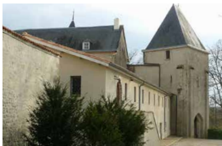
▲ Le château de Maumont, datant du XIV e et XV e siècle, est devenu une abbaye bénédictine en 1957.

Les conférences données par Mgr François Blondel, évêque émérite de Viviers, nous ont éclairés en évoquant les rencontres de Jésus : l'aveugle Bartimée, la Samaritaine... Ces temps ont alterné avec les