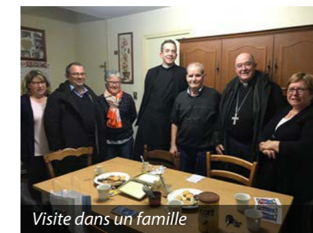
Visite dans une famille