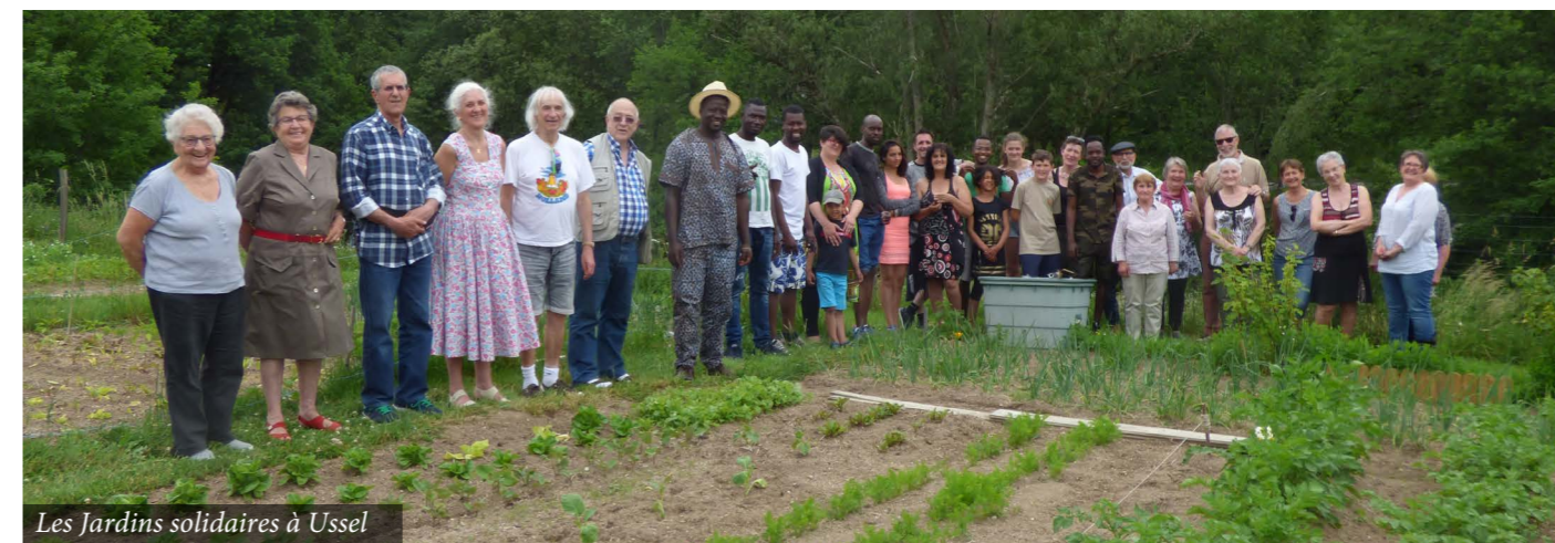
Les Jardins solidaires à Ussel

(*) Pour en savoir plus visionnez deux vidéos : www.youtube.com/watch?v=Jsjorzpl4o (visages de la Pauvreté en 2019) www.youtube.com/watch?v=7u1cGv1luzw (interview de Véronique Fayet du 7/11/2019)