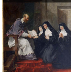
Saint François de Sales donnant à sainte Jeanne de Chantal la règle de l'ordre de la Visitation