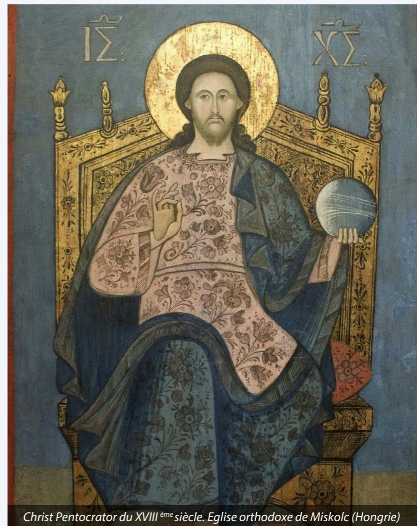
Christ Pentocrator du XVIII ème siècle. Eglise orthodoxe de Miskolc (Hongrie)