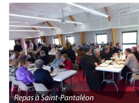
Repas à Saint-Pantaléon