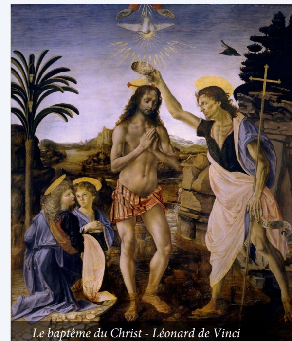
Le baptême du Christ - Léonard de Vinci

Vatican II, constitution Lumen gentium , 34.