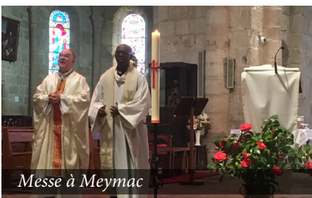
Messe à Meymac