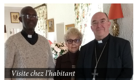
Visite chez l'habitant