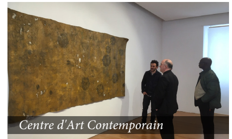
Centre d'Art Contemporain