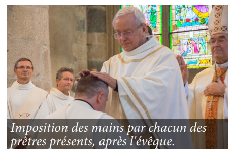
Imposition des mains par chacun des prêtres présents, après l'évêque.

son Fils et dans l'Esprit Saint, poursuive son œuvre de rassembler et de guider les hommes, de les faire vivre de sa Parole et de les nourrir de sa grâce dans les sacrements."