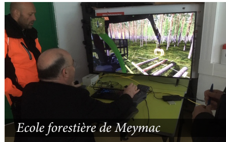
Ecole forestière de Meymac

Toutes les photos de la visite pastorale à retrouver sur le site internet du diocèse www.correze.catholique.fr