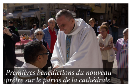
Premières bénédictions du nouveau prêtre sur le parvis de la cathédrale