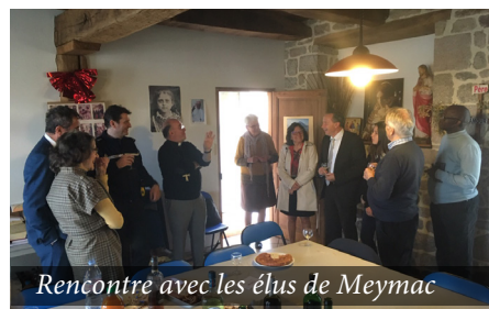
Rencontre avec les élus de Meymac