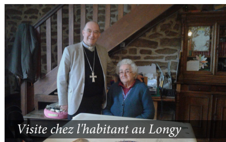
Visite chez l'habitant au Longy