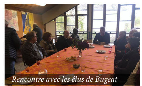
Rencontre avec les élus de Bugeat