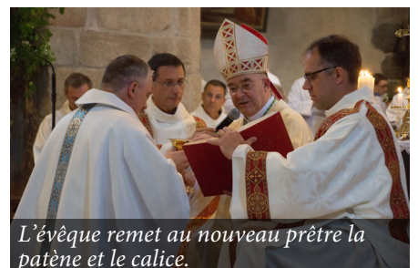
L'évêque remet au nouveau prêtre la patène et le calice.