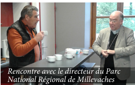
Rencontre avec le directeur du Parc National Régional de Millevaches