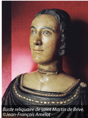
Buste reliquaire de saint Martin de Brive.

Il naquit en Espagne dans une famille païenne et idolâtre. Devenu chrétien dans sa jeunesse, il quitta son pays et séjourna dans le Périgord. Son enthousiasme pour le Christ lui fit renverser un autel païen. La foule se rua sur lui, le lapida et un agresseur furieux lui trancha la tête. Un village de Corrèze garde sa mémoire : Saint-Martin-La-Meanne.