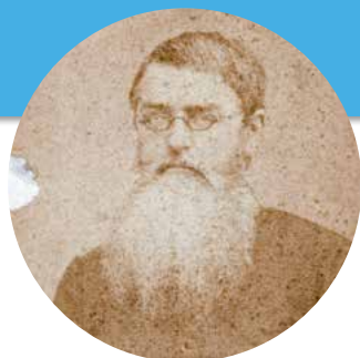
Père Pierre-Henri Borie

Chaque mois, découvrez une figure marquante de Corrèze