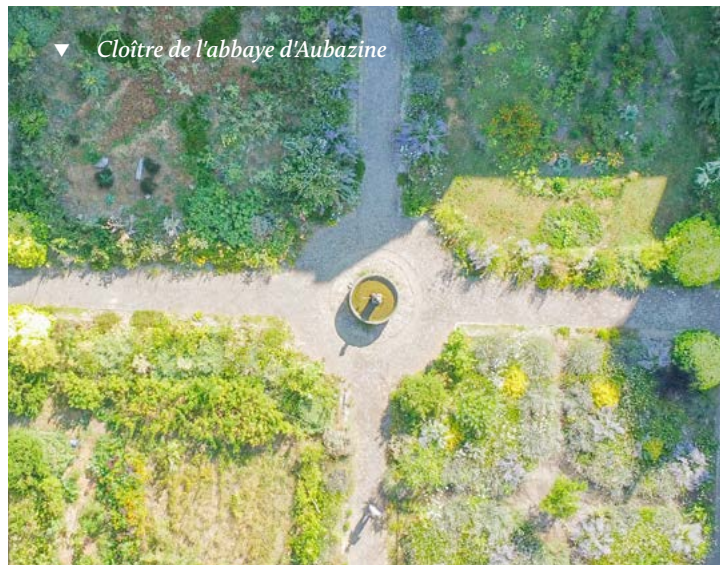
▼ Cloître de l'abbaye d'Aubazine