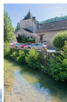
La Vierge de Fournet surplombe le petit village et son église, bordée par la Couze.