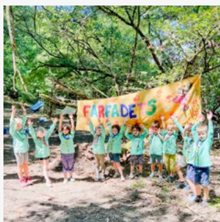
Camps des Scouts et Guides de France