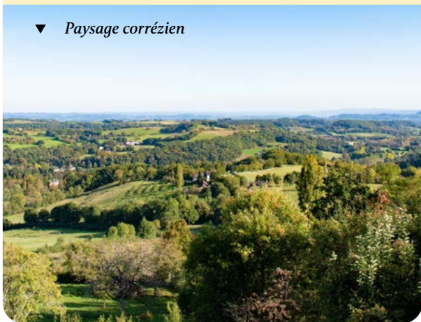
▼ Paysage corrézien