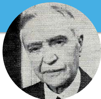
Jean-Baptiste Henri Aimé Surchamps

Chaque mois, découvrez une figure marquante de Corrèze