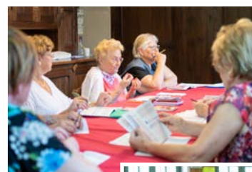
Les échanges sont animés, toujours bienveillants et se concluent comme il se doit par un gâteau fait-maison.