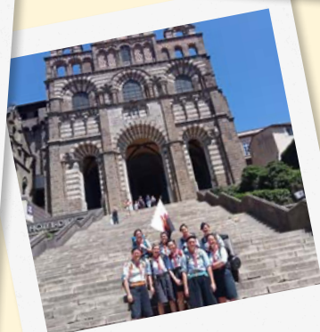
Camps des Scouts et Guides d'Europe