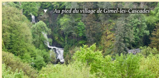
▼ Au pied du village de Gimel-les-Cascades