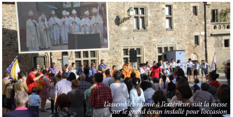
L'assemblée réunie à l'extérieur, suit la messe sur le grand écran installé pour l'occasion