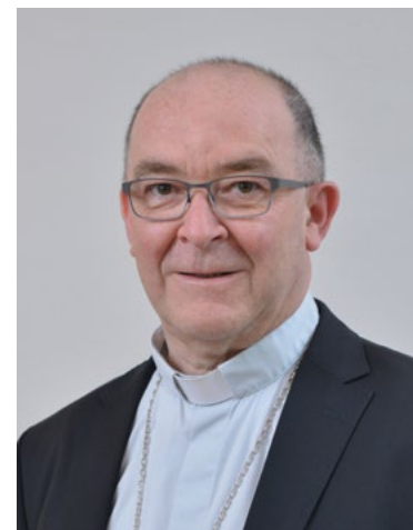
+ Francis BESTION Évêque de Tulle

- Le colloque théologique sur l'Église, le 17 novembre, à Bossuet (Brive) , ouvert à tous, mais où