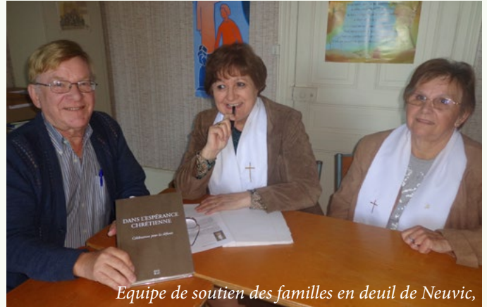
Equipe de soutien des familles en deuil de Neuvic,

J'ai parfois des surprises après les cérémonies : « Merci de vous êtes investie dans ce dernier adieu à maman,