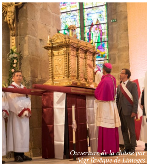
Ouverture de la châsse par Mgr l'évêque de Limoges