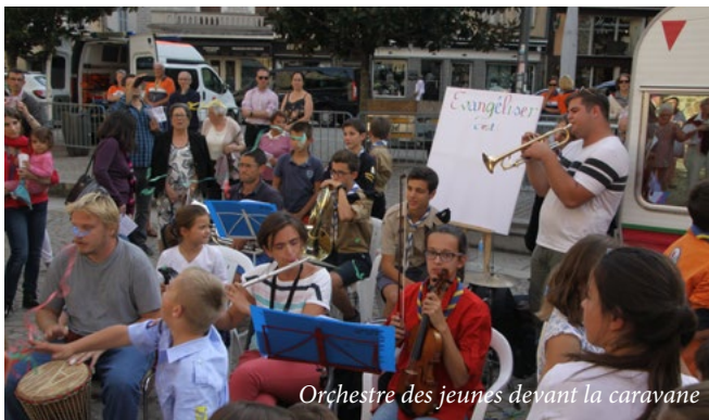
Orchestre des jeunes devant la caravane

saint Martial est proposée à l'assemblée. Par ce geste de grande piété, chacun a pu rendre grâce pour la vie du saint, et le prier d'intercéder pour nous, lui qui jouit de la plénitude de la communion avec Dieu.