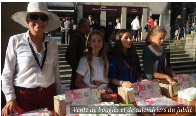
Vente de bougies et de calendriers du jubilé