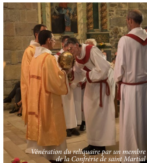
Vénération du reliquaire par un membre de la Confrérie de saint Martial