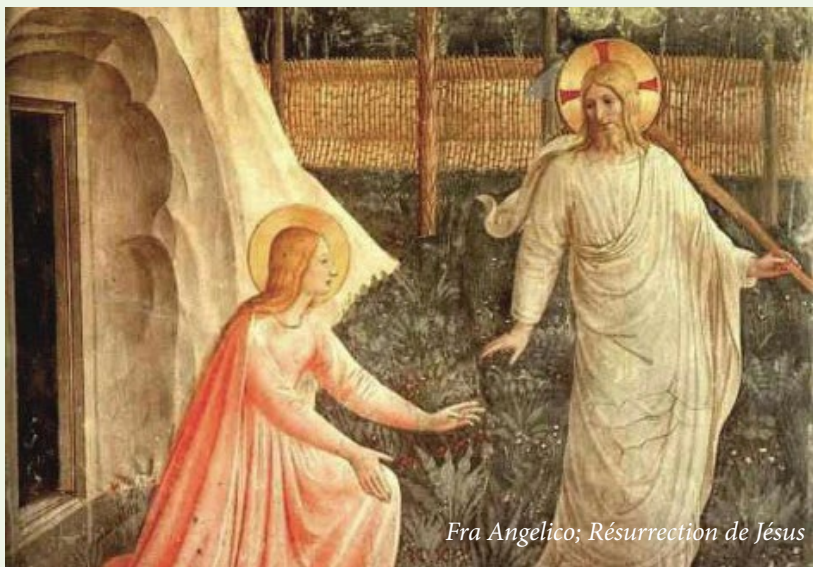
Fra Angelico; Résurrection de Jésus

En souvenir de la mort, de la sépulture et de la résurrection du Seigneur, mystère à la lumière duquel se manifeste le sens chrétien de la mort, l'inhumation est d'abord et avant tout la forme la plus idoine pour exprimer la foi et l'espérance dans la résurrection corporelle.