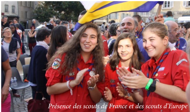
Présence des scouts de France et des scouts d'Europe