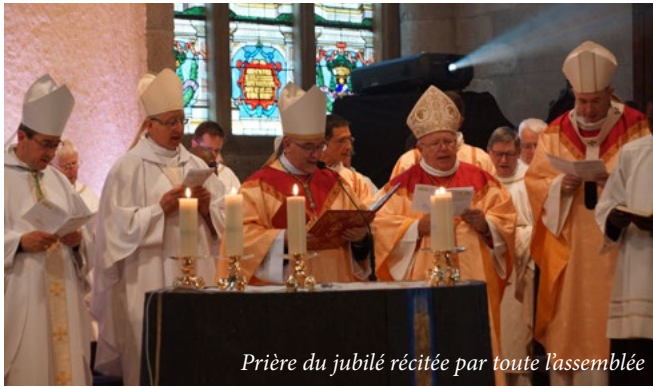
Prière du jubilé récitée par toute l'assemblée