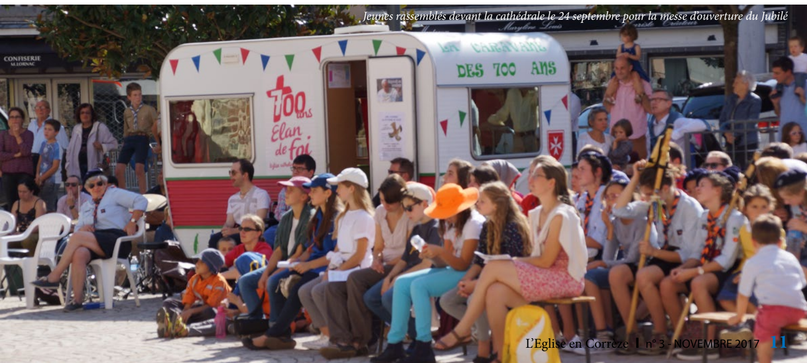
Jeunes rassemblés devant la cathédrale le 24 septembre pour la messe d'ouverture du Jubilé

« Plusieurs prêtres, des diacres, le Cardinal, Mgr l'évêque, étaient réunis pour célébrer les 700 ans du diocèse. Les gens étaient si nombreux que certaines personnes suivaient la célébration dehors grâce à des écrans géants. Ceux qui le voulaient ont embrassé une coupe dorée qui contenait les reliques de saint Martial ».