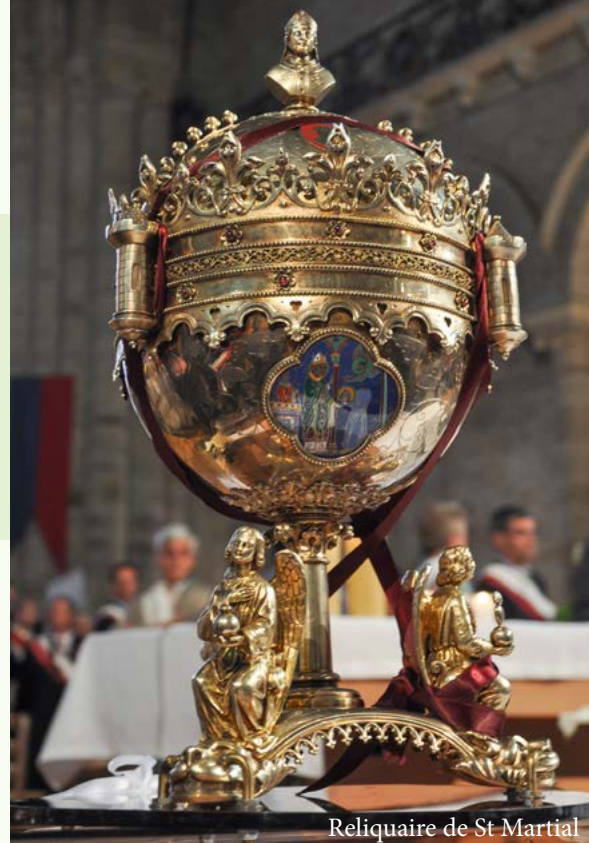
Reliquaire de St Martial

Notre but est de promouvoir saint Martial, de préserver ses reliques, et de mettre tout en œuvre pour valoriser l'histoire de l'Église en Limousin. [...] Nous nous devons également d'être investis dans la vie de l'Église.