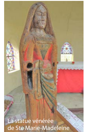
La statue vénérée de Ste Marie-Madeleine

présentes ont été invitées au vin d'honneur offert par la municipalité de Soursac. Compte tenu du temps incertain, le pique-nique a eu lieu à la salle de la Sogne dans une ambiance chaleureuse. Sage décision puisque une heure après une grosse averse tombait sur la région.