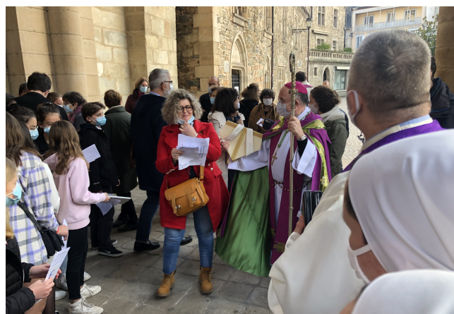
Les jeunes de Tulle remettent leur message à a sortie des vêpres

Nous vous souhaitons une belle découverte de notre région.