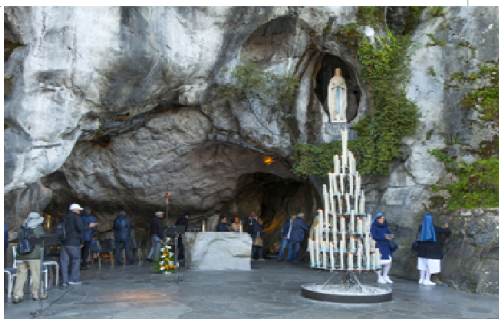
Jeudi 11 février marque l'anniversaire de la première apparition de Notre-Dame de Lourdes à Bernadette Soubirous à la grotte de Massabielle. Dix-sept apparitions suivront celle-ci jusqu'au 16 juillet 1858.

Cela commence vers les années 70/80, quand la société constate et déclare que : Vieillir devient un problème « à résoudre » ...C'est l'époque où la famille traditionnelle commence à se fissurer. Les jeunes partent chercher du travail au loin (exode rural " les corréziens de Paris"), les campagnes se dépeuplent ...La catégorisation des individus s'instaure peu à peu, avec la notion nouvelle de la "dépendance" pour les personnes âgées. C'est l'époque du "jeunisme" qui s'installe. Il faut à tout prix rester jeune. Le refoulement des personnes âgées vers les Ehpad ou autres