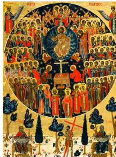
table catéchèse, vivante et proche de nous. Elle nous montre l'actualité de la Bonne Nouvelle et la présence agissante de l'Esprit Saint parmi les hommes. Témoins de l'amour de Dieu, ces hommes et ces femmes nous sont proches aussi par leur cheminement – ils ne sont pas devenus saints du jour au lendemain –, par leurs doutes, leurs questionnements... en un mot : leur humanité.

La vie de ces saints constitue une véri-