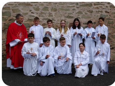
1ère COMMUNION A VARETZ