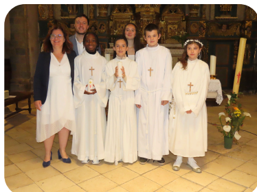
1ère COMMUNION A VIGEOIS